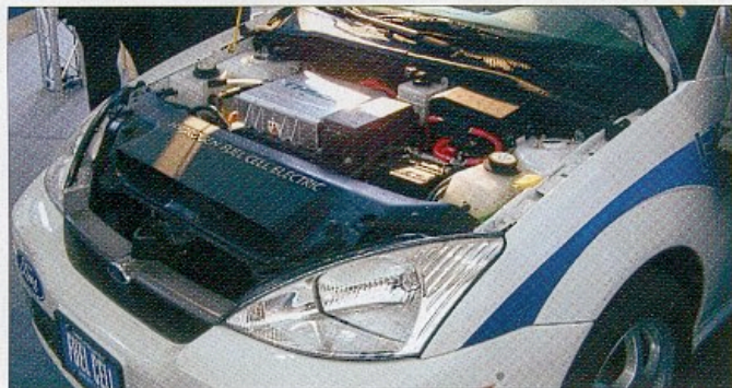
Ford Focus med bränslecellsmotor.