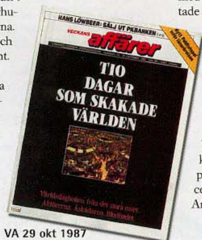
VA 29 okt 1987

Få krascher i världshistorien kan dock mäta sig med den stora börskraschen 1987.