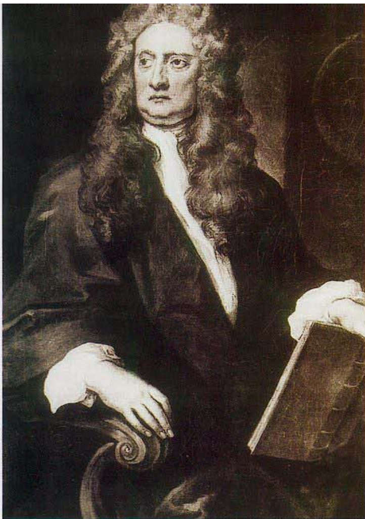
Isaac Newton spekulerade – och förlorade.